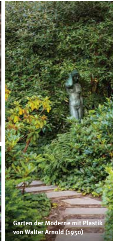
Garten der Moderne mit Plastik von Walter Arnold (1950)