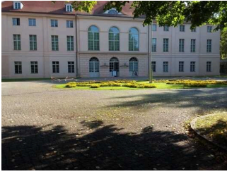
Weg zwischen dem Westtor und dem Schlosseingang

Wir haben für Sie einige Fotos aus dem Betrieb / Angebot zusammengestellt. In den Detailberichten finden Sie weitere Fotos.