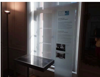
Ausstellungsräume 1. Stock