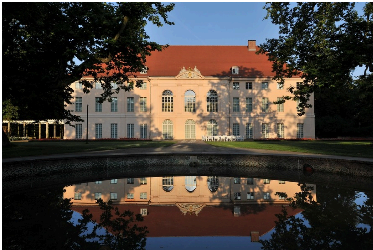
Schloss Schönhausen