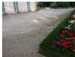
Wege in der Gartenanlage