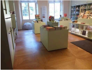
Raum mit Kasse/ Shop/Schließfächern