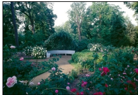
Berlin, Pfaueninsel, Rosengarten Foto: SPSG, Hans Bach, 1999