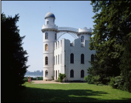
Berlin, Pfaueninsel, Schloss Foto: SPSG, Jörg P. Anders, 1986