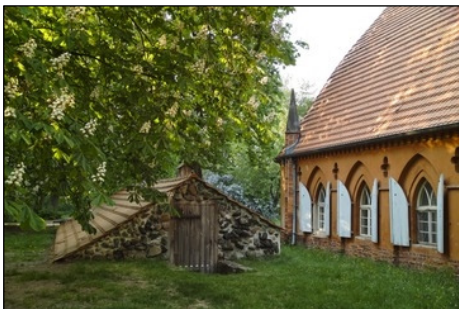
Berlin, Pfaueninsel, Kartoffelkeller und ehemaliger Rinderstall an der Meierei

Bau aus dem Anfang des 19. Jahrhunderts.