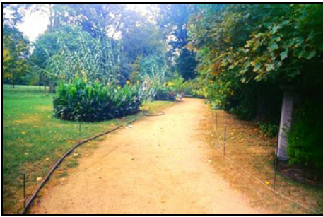
Berlin, Pfaueninsel, Wegebau Luisentempelweg, Palmenhausweg Foto: SPSG, Jan Uhlig, 2006