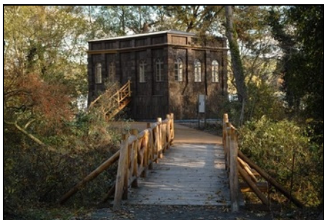
Berlin, Pfaueninsel, Beelitzer Jagdschirm (Borkenhäuschen) Foto: SPSG, Hans Bach, 2012

Erbaut von Johann Gottlieb Brendel. Auf Veranlassung Friedrich Wilhelms III. 1796 aus den Beelitzer Bergen auf die Pfaueninsel überführt.