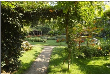
Berlin, Pfaueninsel, Runder Blumengarten

Nachpflanzung/Ergänzung historischer Rosen als Büsche und Hochstämme. Erneuerung der Wege- decksicht. Erneuerung der Chaussee 4. Bauabschnitt zwischen Fährhaus und Kreuzung östlich der Gärtnerei. Erneuerung des Buchsbaumweges und der angrenzenden Wegeflächen zum Fährberg und der Chaussee bis zur Einmündung der Voliere. Fertigstellung der Neuordnung der Beete am Palmenhausplatz. Abschluss der Erneuerung der Wegeflächen an der Voliere und des östlich der Voliere gelegenen Weges am ehemaligen Hirschgehege. Fertigstellung der Wegeflächen am Beelitzer Jagdschirm/Hirschsiele. Anlage einer Wildgehölzhecke südwestlich des Rinderstalles der Meierei. Umbruch und Kultivierung der Wiese südlich des Ackers. Fortsetzung der Pfauenzucht. Bewei- dung durch Schafe und Wasserbüffel. Anbau von Champagner-Weizen und Kartoffeln.