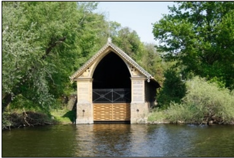
Berlin, Pfaueninsel, Fregattenschuppen

1832 von Albert Dietrich Schadow für die königliche Fregatte „Royal Louise“ errichtet.