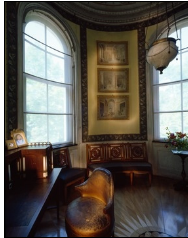
Berlin, Pfaueninsel, Schloss Pfaueninsel, Turmkabinett