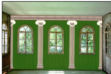
Berlin, Pfaueninsel, Beelitzer Jagdschirm (Borkenhäuschen), Rekonstruktionszeichnung der Innenraumfassung aus dem 18. Jahrhundert Zeichnung: Büro für Restaurierung, Dr. Raue, 2012