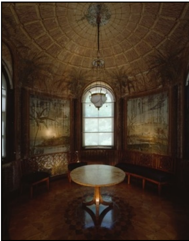
Berlin, Pfaueninsel, Schloss Pfaueninsel, Otaheitisches Kabinett

Restauratorische Wartung mechanischer, beweglicher Teile an Fenstern und Türen. Konservatorische Instandsetzung von Rollladenklappen und Rollladengurtführungen.