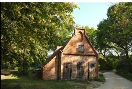
Berlin, Pfaueninsel, Remise am ehemaligen Rinderstall in der Nähe der Meierei Foto: SPSG, Hans Bach, 2012

1802 wahrscheinlich von Friedrich Ludwig Carl Krüger errichtet.