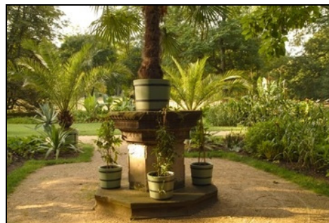
Berlin, Pfaueninsel, Sandsteinpostament in der Mitte des ehemaligen Palmenhausplatzes