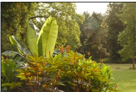
Berlin, Pfaueninsel, Beetfläche am Palmenhausplatz Foto: SPSG, Hans Bach, 2012

Neuordnung der Blumenbeete in Lage, Form und Größe gemäß Meyer-Plan 1845 am Schloss. Nachpflanzung/Ergänzung historischer Rosen als Büsche und Hochstämme im Lennéschen Rosengarten. Erneuerung der Wegeflächen der Chaussee, 1. Bauabschnitt zwischen Fährhaus und Einmündung Buchsbaumweg östlich Gärtnerei, 2. Bauabschnitt Meierei/Meiereiwiese/Luisentempel. Rasenansaat im Bereich des ehemaligen Palmenhausplatzes. Einbau von Entwässerungsrinnen an erneuerten Wegen im Bereich Voliere/Wasservogelteich. Fortsetzung der Pfauenzucht. Restaurierung des östlichen und südlichen Höhenuferweges und Verlegung der bisherigen Wegetrasse nach Meyer 1845 und Grabungen. Anlage beziehungsweise Freilegung des Kunkelschen Bades gemäß Grabungsergebnissen im Bereich Liegewiese/Ackerfläche. Anlage einer Wildgehölzhecke südwestlich des Rinderstalles der Meierei. Abbau des Wildgatterzaunes.