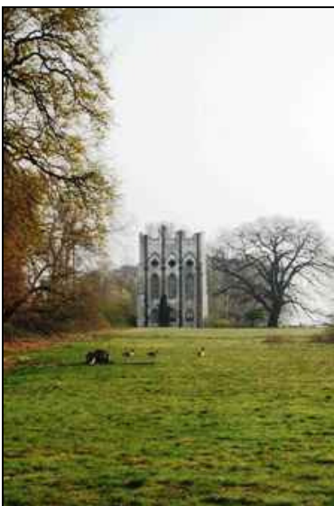
Berlin, Pfaueninsel, Meierei, Westfassade 2014 vor Instandsetzung der Putzoberfläche

Sanierung und Konservierung der Putze der West- und Südfassade des Turmes. Molkenstube – exemplarische Freilegung der Wand- und Deckenfassung, technologische Untersuchung, Erfassung des Erhaltungszustandes und Konzepterstellung.