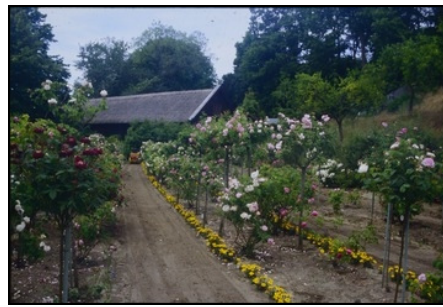
Berlin, Pfaueninsel, Rosen im Rosenergänzungsgarten Foto: SPSG, Jan Uhlig, 2005