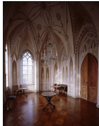
Berlin, Pfaueninsel, Meierei, Großer Saal Foto: SPSG, Leo Seidel, 2006

1992 Verschiedene Zimmerer- und Holzbauarbeiten.