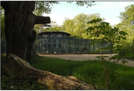
Berlin, Pfaueninsel, Vogelvoliere