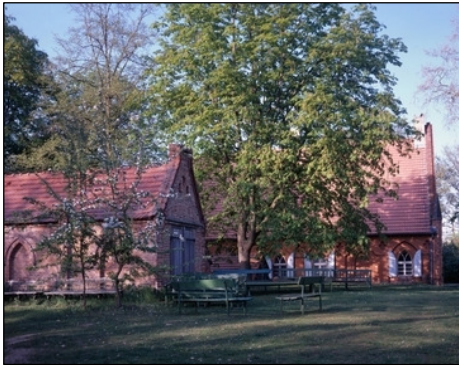
Berlin, Pfaueninsel, Blick auf rote Backsteinhäuser (Pferdestall)

1802 wahrscheinlich von Friedrich Ludwig Carl Krüger erbaut.