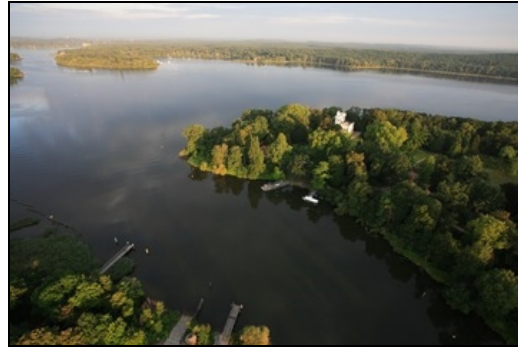
Berlin, Pfaueninsel, Fährstation und Schloss aus der Luft gesehen

1793 Erwerbung des damaligen Kaninchenwerders durch König Friedrich Wilhelm II. wegen der Nähe zum Marmorpalais im Neuen Garten. Errichtung des Schlosses durch Johann Gottlieb Brendel in den Formen einer mittelalterlichen Burgruine. 1793 Beginn der Anlage der sentimental Gartenpartien im westlichen Teil in Schlossnähe. Ab 1797 Sommersitz König Friedrich Wilhelms III. Unter ihm zahlreiche Bauten, ausgeführt von Friedrich Ludwig Carl Krüger. Es erfolgte durch Ferdinand Fintelmann und Peter Joseph Lenné zwischen 1816 und 1834 im Zusammenhang mit der Erweiterung der Sammlung exotischer Tiere eine durchgreifende Veränderung zu einem in drei Zonen gegliederten klassischen Landschaftsgarten: dem intensiv gestalteten Teil mit Schmuckanlagen um die Schlosswiese, dem hainartig belassenem Waldbestand im Menageriebereich in der Mitte der Insel und der ästhetisch geprägten Landwirtschaft um die Meierei im nordöstlichen Teil. Im 1. Drittel des 19. Jahrhunderts verschiedene Bauten nach Plänen von Karl Friedrich Schinkel und Albrecht Dietrich Schadow. Die Menagerie mit ihrem exotischen Tierbestand wurde 1842 nach Berlin überführt. Die Insel steht seit 1924 unter Naturschutz. In der Nachkriegszeit verschiedene Wiederherstellungsarbeiten (Rekonstruktion des Rosengartens und verschiedener Wege) im Sinne einer Wiedergewinnung des ursprünglichen Zustandes aus der Mitte des 19. Jahrhunderts.