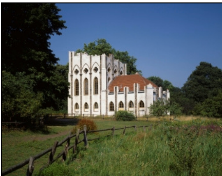
Berlin, Pfaueninsel, Meierei Foto: SPSG, Jörg P. Anders, um 1990

1795 von Johann Gottlieb Brendel in Form einer künstlichen gotisierenden Ruine erbaut. Im 2. Geschoss befindet sich ein Saal nach Entwurf Philipp Boumanns d. J. mit gotisierenden Stuckaturverzierungen von Constantin Philipp Georg Sartori und Wandmalereien des Berliner Theatermalers Bartolomäus Verona.