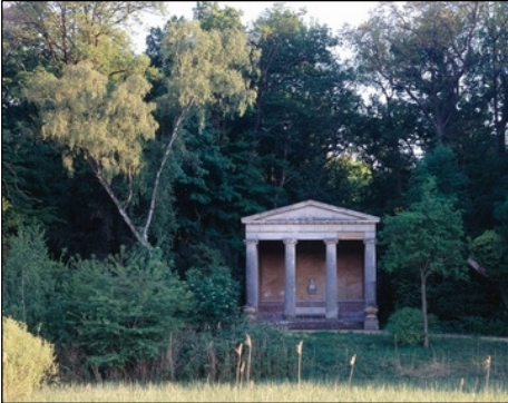
Berlin, Pfaueninsel, Luisentempel

1811 von Heinrich Gentz für den Charlottenburger Park errichtet, 1829 zur Pfaueninsel überführt und mit neuer Rückwand wiederaufgebaut.