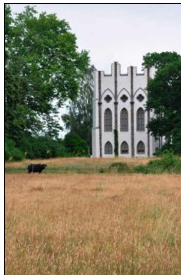
Berlin, Pfaueninsel, Meierei, Westfassade 2015 nach Instandsetzung der Putzoberfläche