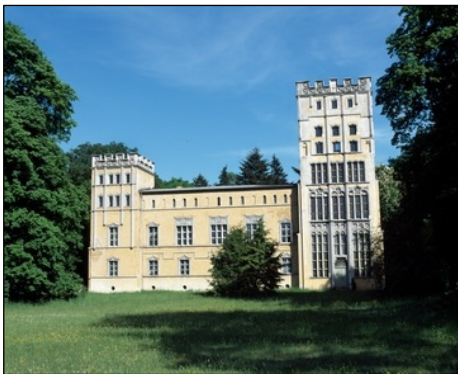
Berlin, Pfaueninsel, Kavalierhaus, Ansicht von Osten

1803/04 von Friedrich Karl Krüger als Vierseithof mit zweitürmigem Wohnbau errichtet. 1824/1826 Abriss der Nebengebäude und Umbau durch Karl Friedrich Schinkel, der den südlichen Turm vergrößerte und eine vom König erworbene spätgotische Patrizierhausfassade aus der Danziger Brodbänkengasse einbaute.