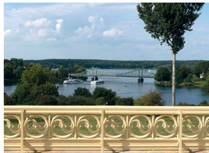
Blick in die Havellandschaft View to the Havel Landscape