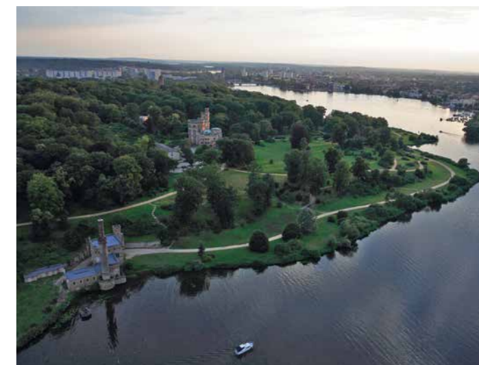
Der Park Babelsberg aus der Vogelschau Babelsberg Park from a Birds' Eye View