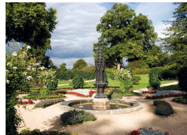
Der Gotische Garten mit Brunnen The Gothic Garden with Fountain