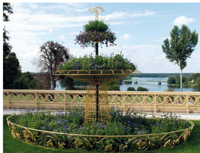
Die Blumenfontäne auf der Goldenen Terrasse Fountain of Flowers on the Golden Terrace