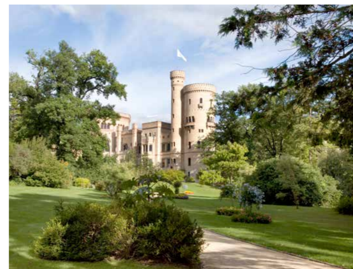
Blick aus dem Pleasureground View from the Pleasure Ground