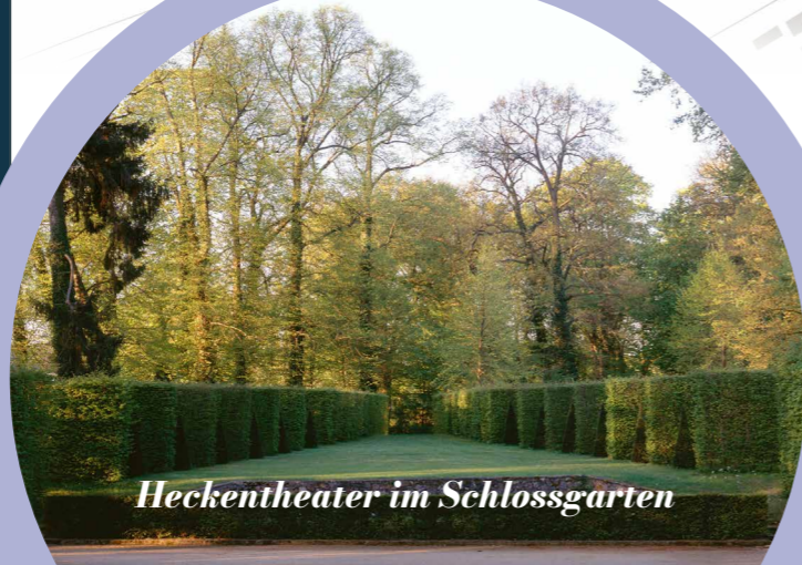
Heckentheater im Schlossgarten