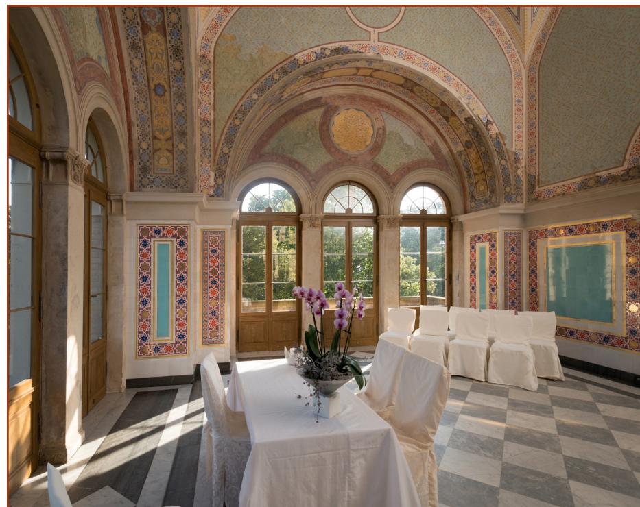
Das Maurische Kabinett im Belvedere Pfingstberg. The Moorish Cabinet in the Pfingstberg Belvedere.

When you were a child, did you dream about getting married in a palace? This dream can come true at the Pfingstberg Belvedere. High above the city of Potsdam, from May to October, the Standesamt Potsdam (Potsdam Registry Office) and the Förderverein Pfingstberg e.V. offer the experience of a wedding set before a romantic backdrop. The Moorish Cabinet in the palace's eastern tower, designed with ceiling paintings, marble floors and noble red-blue-gold tiles, offers a celebrational framework for an unforgettable setting to say "I do." After the ceremony, while your guests can spend time enjoying Potsdam's most beautiful views on a guided tour through the historical ensemble, you'll have an opportunity to have your wedding photos taken. Then come together with your wedding guests and clink glasses at a festive reception, or arrange an unforgettable celebration surrounded by the historical Pfingstberg ensemble.